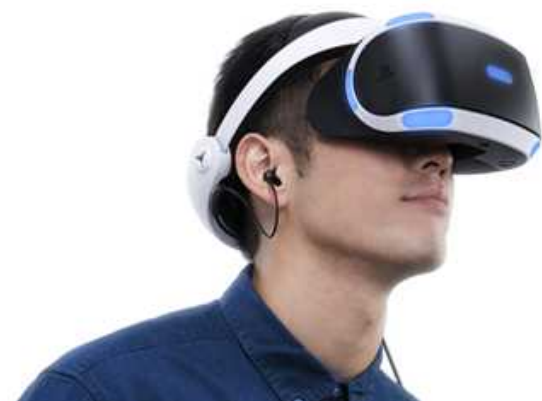
V Rの映像による仮想体験