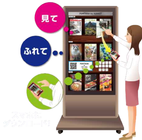
スマートフォンで資料が受け取れる デジタルサイネージ