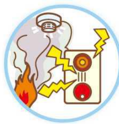
自動火災報知設備