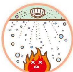
スプリンクラー設備