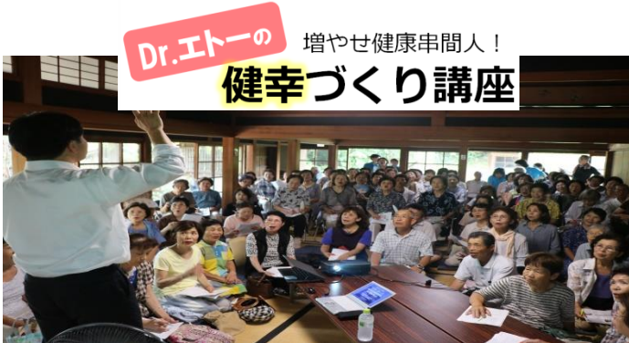
Dr.エトの 増やせ健康仲間！ 健幸づくり講座

市民の皆さんが健やかで幸せ(健康＝健幸)であるために、健康情報と市の取り組みをお知らせします♪