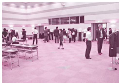
新制服選定委員会の様子

ベースデザインは、プレゼン後に行ったアンケート結果を参考に、総務部と新制服選定委員会の合同部会で決定します。