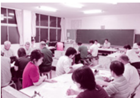
進捗状況報告会の様子

意見交換では、保護者や地域の方々より、たくさんの質問やご意見をいただきました。今後、今回いただいたご意見なども踏まえながら、各部会や地区別協議会などで準備を進めてまいりたいと思います。