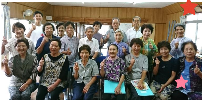
【実習で参加した福島高校生と一緒にパチリ♪】