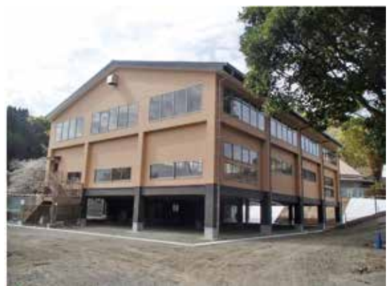
【新しい中学校：武道場 平成28年3月 完成】