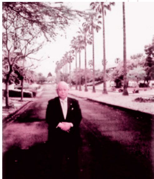
南九州大学（高鍋）にて