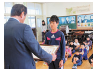
感謝状贈呈の様子（金谷小）

今年度「人権の花」運動に取り組んできた金谷小学校と本城中学校の児童生徒に、感謝状が贈られました。この運動は、児童生徒が協力し合い、人権の花を育てることを通して、命の大切さや相手への思いやりを身に付けてもらおうと昭和57年から実施しています。