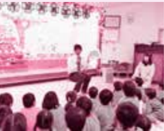
保育園でひな祭りのことを 教えてもらいました