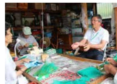
住民との対話で地域の課題を探ります

55歳までJAはまゆう勤務。2015年には市のくしまdeスローライフサポートマネージャーとして集落づくりなどに取り組む。現在68歳。