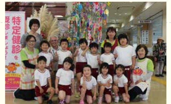
年長組11名が施設を訪れました

千種保育所の園児が市民病院と総合保健福祉センターに自作の七夕飾りを贈りました。5月末から園児全員で作り始め、「みんなが元気になりますように」などと字を覚えたての園児が書いた短冊や輪つなぎなど、色とりどりの飾りが病院と福祉センターに彩りを添えていました。