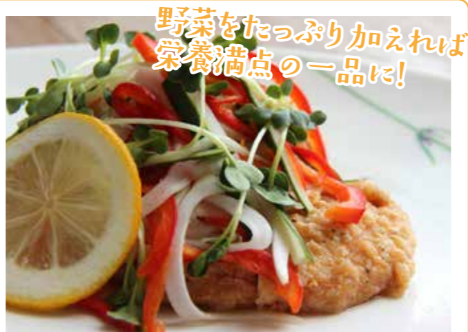
野菜をたっぷり加えれば栄養満点の一品に！