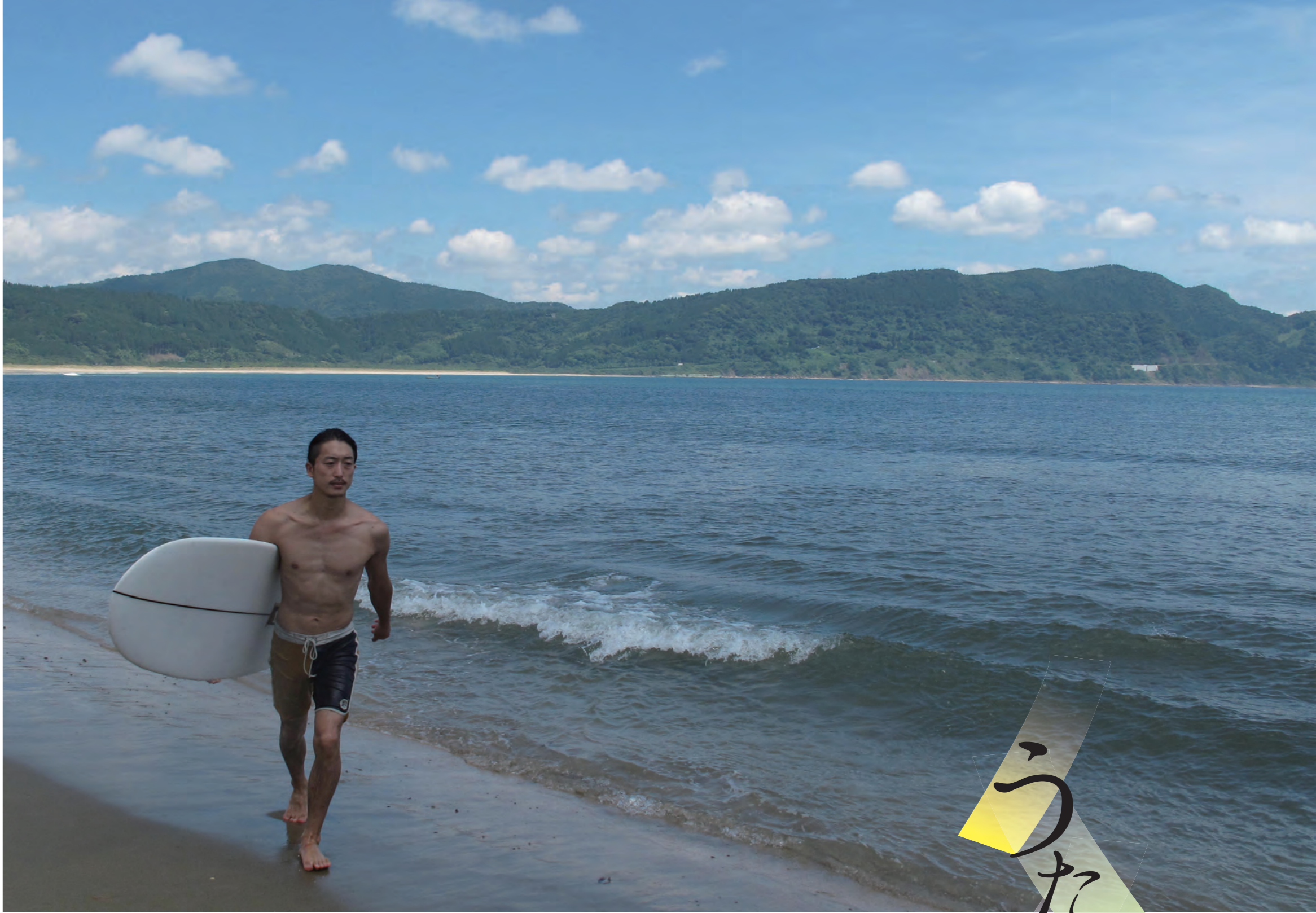
【市木地区・石波海岸】日本の渚百選にも指定されている石波海岸をバックに、サーフボードを持ち市木をこよなく愛する青年を撮影。

撮影者の川井さんが主催するコスモス倶楽部の写真展を開催します。 期間：8月13日(日)～26日(土) 会場：市文化会館