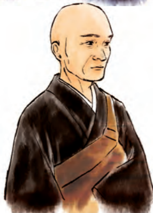
※イラストは全てイメージです

蛇は火を恐れることから、火攻めの戦法をとることになり、勢子全員が手に手に松明を持ち、各方面から大蛇を狩りたてます。ついに逃げ場を失った大蛇は岩穴に逃げ込んだのです。すかさず、衛徳坊は大蛇の口