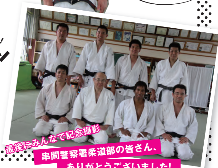
最後にみんなで記念撮影 串間警察署柔道部の皆さん、 ありがとうございました!

受け身も投げもうまくて柔道感覚が優れていますね。続けられればいい柔道家になれるかもしれませんよ。