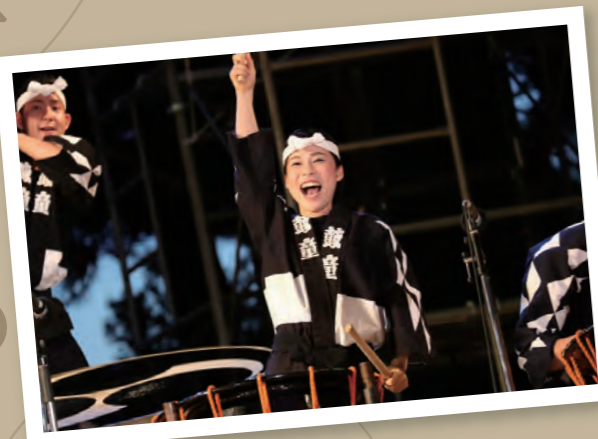
和太鼓の魅力の世界へ