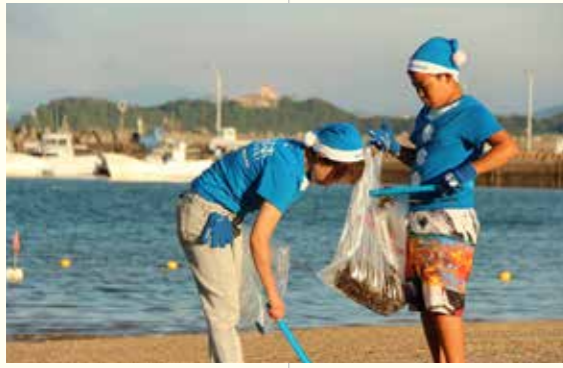
ごみを拾うサンタ姿の参加者