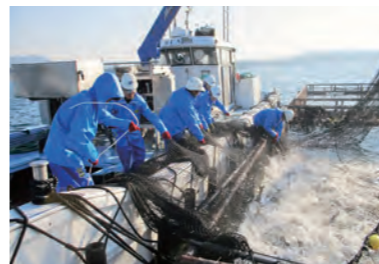
身が大きく鮮度抜群。食欲の落ちる夏こそぜひ食べたい。