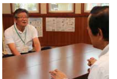
支所長からの情報収集も積極的に行います