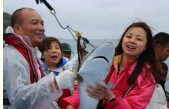
サメを捕まえ大喜び