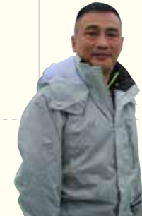
香港在住 バンさん

串間エコツアー「プチ漁師・定置網体験」に香港からの観光客11名が参加しました。インターネットで直接申し込まれたそうで、香港からの直行便で宮崎へ。参加者は漁船に乗り込み、網の中ではねるブリやサメなど大きな魚をタモで救うと大歓声をあげ、串間の海を満喫していました。