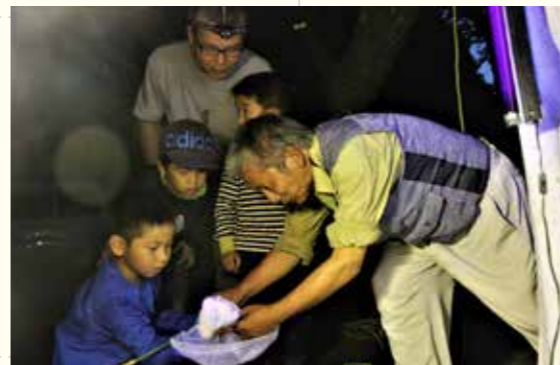
光に集まった昆虫を捕まえる子どもたち