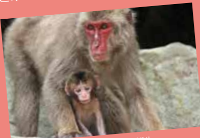
母ザルに見守られる赤ちゃんザル

約90匹の野生ザルが生息する幸島で、今年初めてのザルの赤ちゃんが誕生しました。赤ちゃんザルは母親にぴったりと寄り添い、お乳をねだる愛らしい姿をみせていました。6月中旬から8月が出産シーズンで、今年も例年同様、8頭前後が生まれる見込みです。