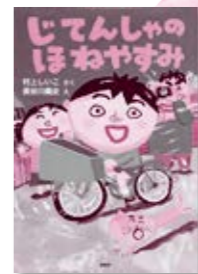
「じてんしゃのほねやすみ」 村上しいこ/著 長谷川義史/え

悪党や、手下たちさえ顔を知らない火盗改・長谷川平蔵。不屈にも「闇の平蔵」を名乗る者が現われて…。鬼平ファンに捧ぐハードボイルド時代小説第3弾。