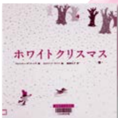
「ホワイトクリスマス」 今月のテーマ展示

ぼくのじてんしゃが、お祭りでおみこしをかつぎたいと言いました！ところが、練習にやってきたじてんしゃは、ぜんぜん力がなく、おみこしをうまくかつげなくて…。