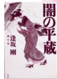
「闇の平蔵」 逢坂剛/著

悪党や、手下たちさえ顔を知らない火盗改・長谷川平蔵。不屈にも「闇の平蔵」を名乗る者が現われて…。鬼平ファンに捧ぐハードボイルド時代小説第3弾。