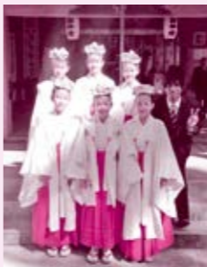
秋祭り神事にて巫女さんと一緒に

あつという間に三ヶ月が経ってしまっ、本当に信じられませんが、毎日が楽しくて、今まで皆さんのおかげでいろいろなことを山ほど習ってきて、とても感謝しています。これからもよろしく願います。