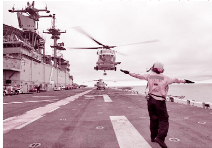
米国防護揚陸艦に着艦し、NAVY ホームページで紹介された一枚。