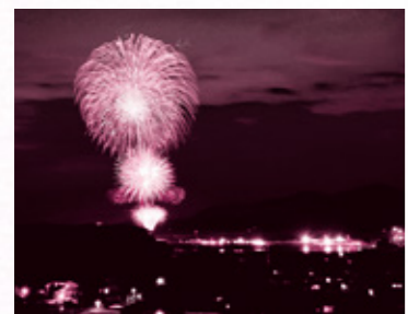
第33回福島港花火大会

き、自主的かつ積極的に交流・協働していく人的ネットワークに支えられた異分野コミュニケーション。産学官民メンバー相互のコミュニケーションを深め、信頼関係を築くことから、ビジネス・プロジェクトなどが動き出すことをモットーに活動する集まりです。 串間市内でもよく見られる基調講演が行われた後、テーマ自由のプレゼンが行われましたが、講演を聞いてただ満足するのではなく、自ら物事を考え、それを自分の言葉で発表し、問い掛けること、このような取り組みから何かが串間の活性化のヒントが見つかるのではないかと思つたところです。