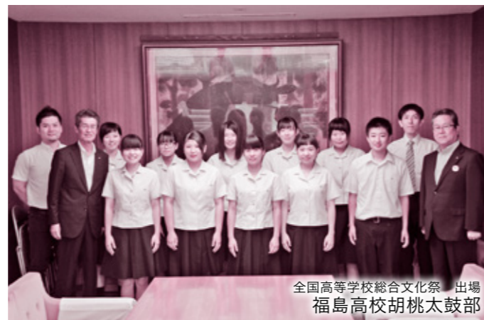
全国高等学校総合文化祭 出場 福島高校胡桃太鼓部