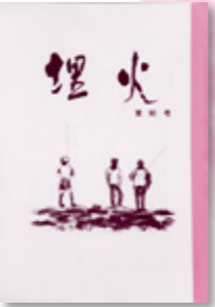
「埋火 第90号」 寄贈作品紹介