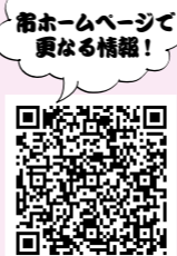
ホームページで 変なる情報!