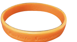
認知症サポーターの印「オレンジリング」

高齢化が進み、将来増加していくことが予想される認知症の患者数。今は若くて関係ないと思っただけでも、あなた自身、家族が突然認知症を患うかもしれません。認知症は決して他人事ではありません。「ひよっとしたら認知症かも」と思ったとき、すぐに対応するためには、認知症を理解しておくことが大切です。この病気を他人事ではなく、自分のこととして考えてみませんか。