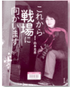
「これから戦場に向かいます」 山本 美香 / 写真と文

36歳未婚女性、古倉恵子。大学卒業後も就職せず、コンビニのバイトは18年目。これまで彼氏なし。ある日、婚活目的の新入り男性、白羽がやってきて、そんなコンビニの生き方は恥ずかしいと突きつけられるが…。