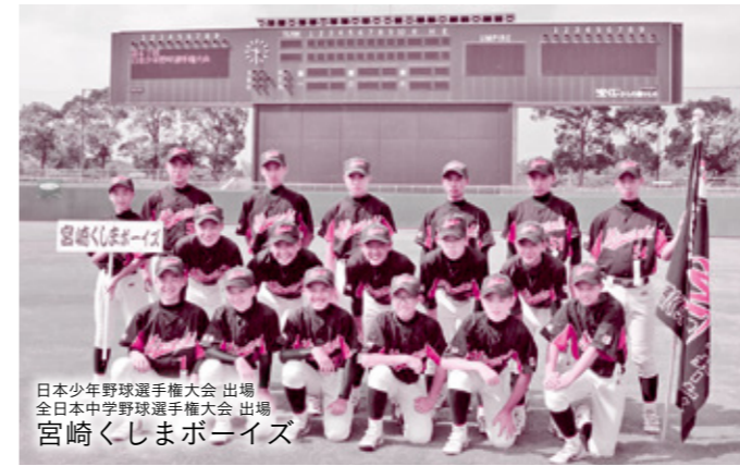
日本少年野球選手権大会 出場 全日本中学野球選手権大会 出場 宮崎くしまボーイズ