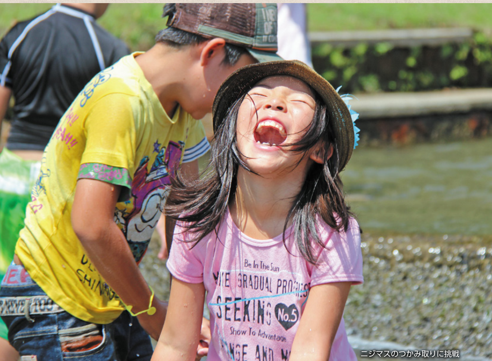
ニジマスのかみ取りに挑戦