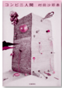
「コンビニ人間」 村田 沙耶香 / 著

36歳未婚女性、古倉恵子。大学卒業後も就職せず、コンビニのバイトは18年目。これまで彼氏なし。ある日、婚活目的の新入り男性、白羽がやってきて、そんなコンビニの生き方は恥ずかしいと突きつけられるが…。