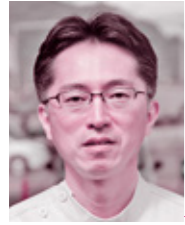
著：串間市民病院 産婦人科 河崎 良和 Yoshikazu Kawasaki