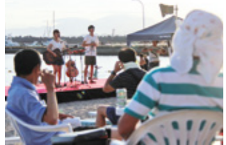
夕日を眺めながら歌を楽しむ来場者

7月30日、高松海水浴場で渚のフェスティバルが開催されました。来場者は、波の音と海に沈む夕日をバックにフラダンスやベリーダンス、音楽グループ「あんべらしゅう」の歌を楽しんでいました。また、景品が当たるゲーム大会も行われ盛り上がっていました。