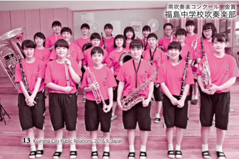
県吹奏楽コンクール 金賞 福島中学校吹奏楽部