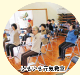
いきいき元気教室

保健師が教える“秘密の体操”により、身体も心も元気になり、認知症予防にも効果あります。詳しくは、広報くしま5月号をご覧ください。