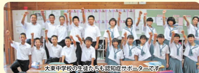
大東中学校の生徒たちも認知症サポーターです

「認知症サポーター養成講座」を受講した人を「認知症サポーター」といいます。認知症サポーターは、何か特別なことをする人ではありません。認知症を正しく理解し、偏見を持たず、認知症の人やその家族に対して温かい目で見守る人のことです。あなたも認知症サポーターになりませんか？