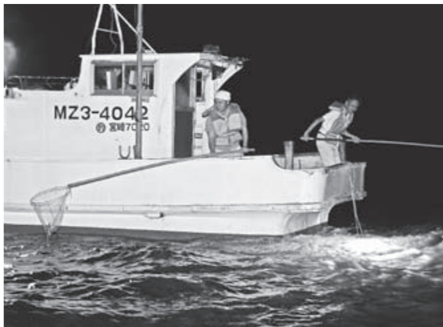
チャンスを逃さないよう海を見つめます