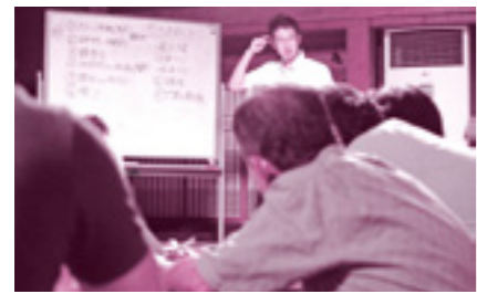
活発な意見交換ができました

市民団体などの交流を深め、情報やノウハウなどの共有を行い、さらなる市民活動の発展を目的に毎年開催している交流会。市内で活動する各団体の代表者など14団体18名が、それぞれの活動紹介や近況報告を行いました。 今回新たに「市民大会」と称して、市民活動について思うことや串間市について考えることを参加者全員で意見を出し合いました。 『会員の意識低下の改善法』『三大祭りの魅力化』など、さまざまなテーマについて議論が行われました。すぐにできること、思いもなかったアイデア、交流の中でしか生まれないものが数多くありました。