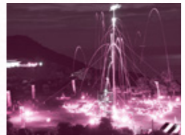
松明で描く炎の放物線

前にとっても厳かな雰囲気になりました。 そして、「柱松」の第一投を市長に代わって努めさせていただきました。事前練習もないうつつけ本番でしたが、観客席に飛んでいったりせず、ほっとしました。 本番では太鼓の響きにのせ、勢子の皆さんが柱松のてっぺんめがけ、松明を次々と投げ込み、松明が夜空に上がるたびに会場からは大きな歓声が上がりました。間もなくして、松明が見事頂上のかごに入り、大蛇に見立てた柱松は倒れ、花火が打ち上がり、大きな拍手が送られました。 今回は節目の50回目。来年が今からとても楽しみです!