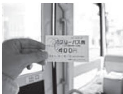
購入した1日フリーバス券