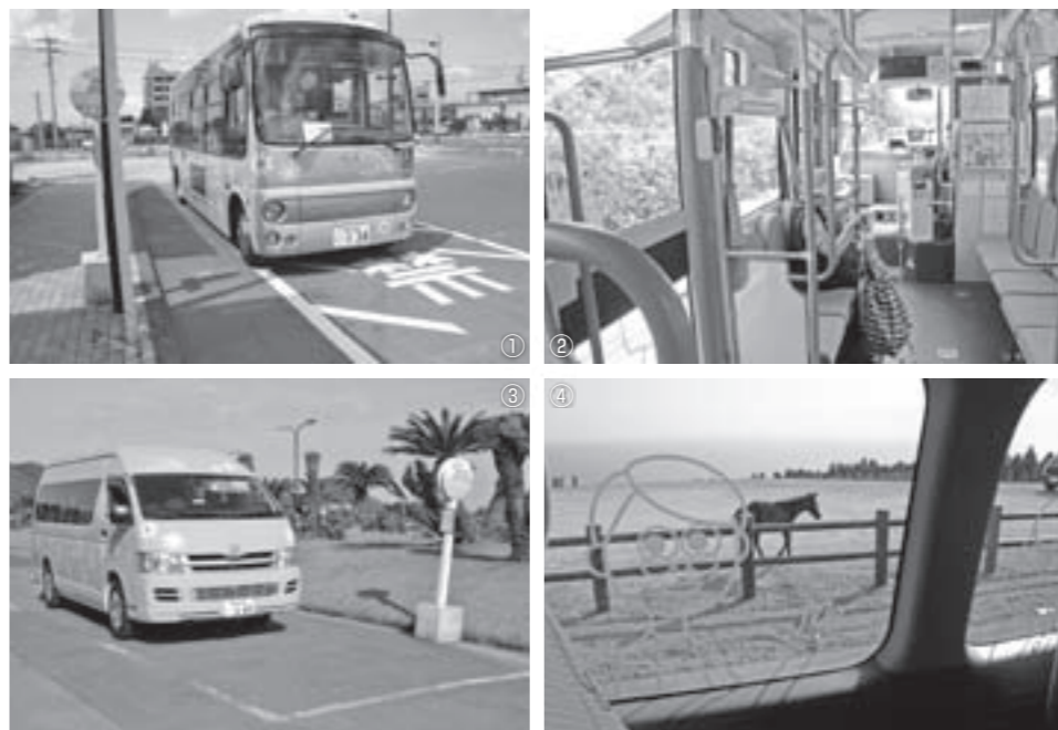
①出発前のよかバス ②ほかの乗客の方も乗ってきます ③都井岬で一休み ④春駒が気持ちよさそうに歩いていた

この日は天気がよく、美しい青空と海を見ることができました。また丘を見上げると御崎馬たちがゆつくり草を食べている光景が目に入ってきます。また、小松が丘広場にて今年生まれた春駒を見ることができました。バスにも近づいてきてくれたので思わず写真を撮りました。貴重な体験となりました。午後5時20分に市民病院に到着しました。今回ご紹介した2つの路線以外にも、曜日ごとに串間の各地区へ向かうバスが走っています。よかバスを使って、市内を探検してみ