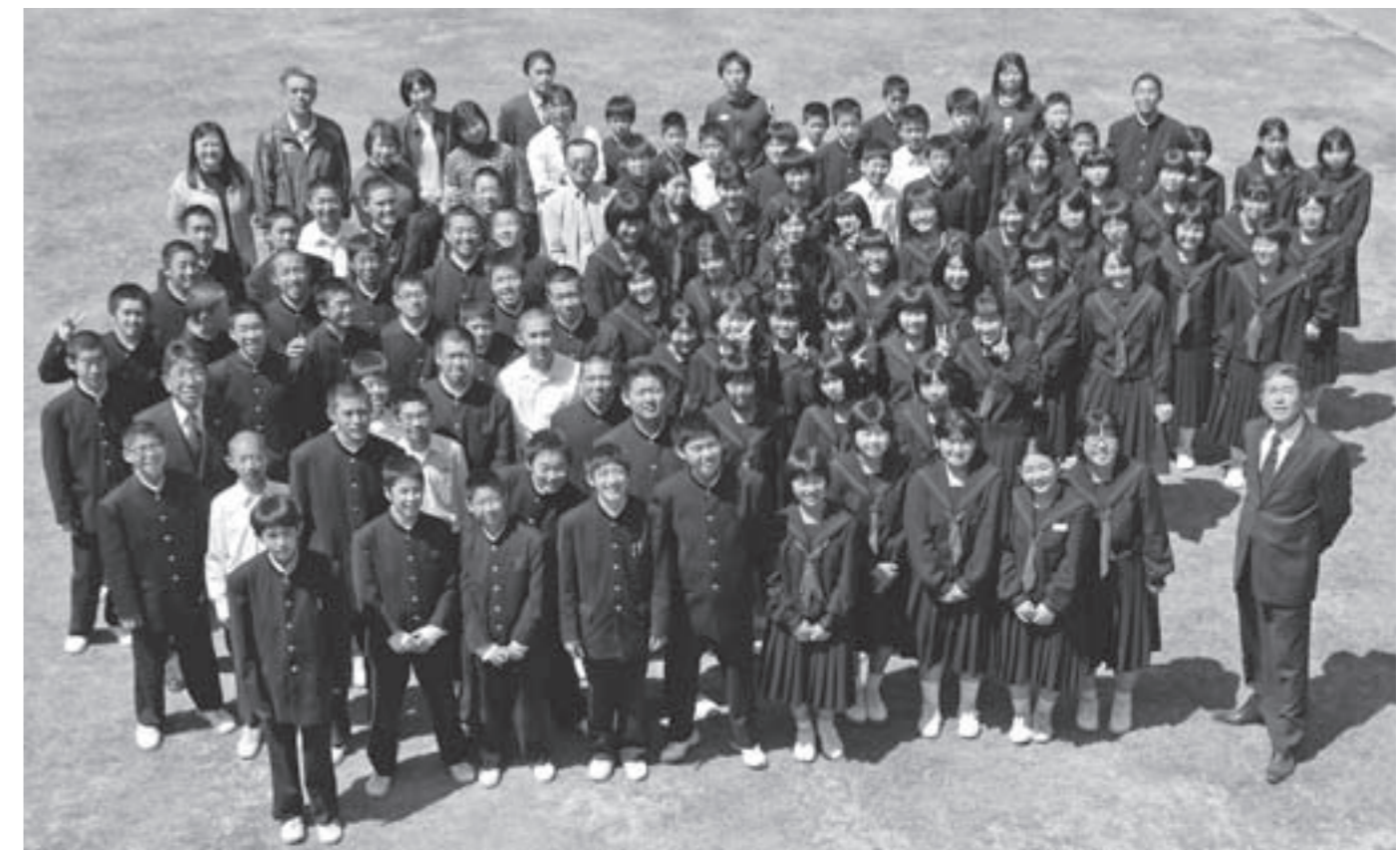
中学校の中庭でみんなそろって撮影。