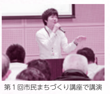
第1回市民まちづくり講座で講演

の取組みとは違つとも思います。みなさんも一度は聞いたことがあるかと思いますが、このまま東京など都市圏への若者流出と若年女性の減少が進めば、2040年には全国896の市区町村に消滅可能性があるという、民間研究機関「日本創成会議」が昨年5月に公表した試算は、全国の地方自治体に大きな衝撃を与えました。この「消滅可能性都市」に残念ながら本市も含まれています。 この困難な課題にみなさんと力を合わせて取り組んでいきたいと思っています。串間の未来について一緒に考えていけることを楽しみにしています。