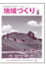
「地域づくり」(毎月発行) 地域活性化の情報誌

●こんな方にオススメ! ・市民活動に興味のある方 ・活動分野のテーマを決 め、全国各地の地域活 化に対する取り組みを 紹介。