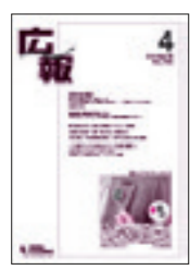
「広報」(毎月発行) 広報力を高める情報誌

●こんな方にオススメ! ・ポスターなどをもっと うまく作りたい方 ・団体や企業で広報に携 われている方 ・広報に関するアドバイ スを多数掲載。人を引き 付けるキャッチコピー、 デザインなどが学べる。