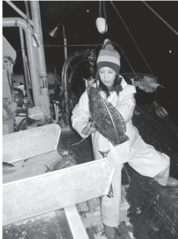
早朝の漁研修の真っ最中。

串間市の都井にて、農林水産省の「漁村派遣研修」の一貫で1カ月間滞在し、小型定置網漁業などを体験しています。この研修は、入省2年目の職員が全国各地に派遣され、農林水産業の実態を経験するプログラムです。