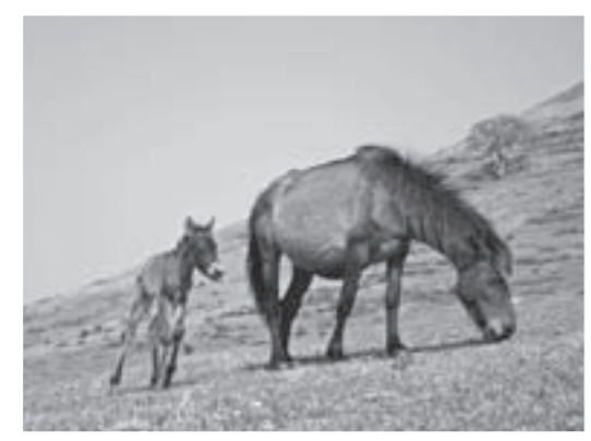
▲都井岬の魅力の一つ、御崎馬。