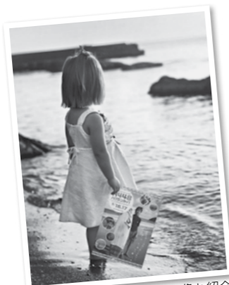
フェイスブックではこんな画像も紹介！

「活動を知ってほしい」「仲間を増やしたい」そんな思いを持たれている方はぜひ一度挑戦してみてくださいいかがでしょうか。簡単ホームページ作成術やフェイス