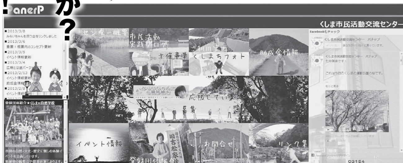
バナップのトップページ(ホームページ)

☆平成25年度公民館自主サークルについても参加者を募集します。詳細は、次回お知らせいたします。