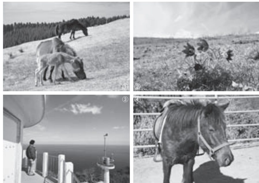
①3月に生まれた春駒。②珍しいオキナグサも見ることができる。③都井岬灯台から眺める大海原 ④名前を募集中。4歳の雄。黒っぽい毛色、体はやや小さめです。

らしい花を見ることが出来ます。灯台からの絶景を堪能 続いて、岬の先端に立つ都井岬灯台へ移動(入場料中学生以上200円、小学生以下無料)。「都井岬灯台は『日本の灯台50選』に選ばれていて、九州で唯一、塔内を見学できる灯台です」と三好さん。塔内の階段を上り外に出てみると、そこには視界いっぱい広がる青い大海