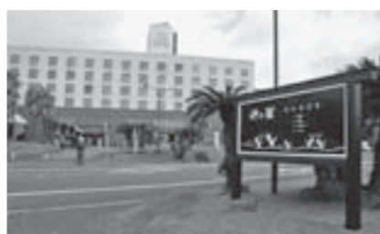
■「岬の駅」都井岬 ☎76-1111 ■「岬の駅」開館時間=午前9時～午後5時半/売店=午前10時～午後5時/レストラン=午前10時～午後4時(ラストオーダーは午後3時半)

本誌5月号の「くしまをあそぼっ」コーナーでも紹介しましたが、都井岬には都井岬ビクタースターや都井岬灯台、なにより御崎馬を身近で観察できる小松ヶ丘や扇山など、ほかにも見どころがいっぱい。休日にはゆつくり都井岬散策を楽しんでみてはいかがでしょうか。