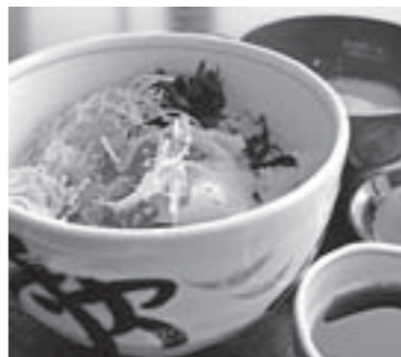
「岬の駅」都井岬の海鮮丼