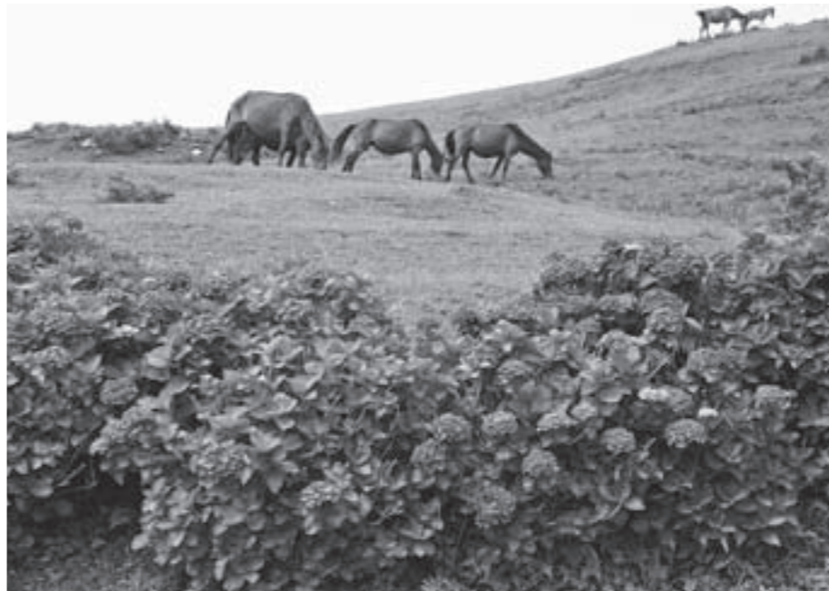
アジサイの傍らで草を食む御崎馬。