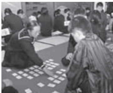
昨年(2009年)の1月6日、旧吉松家住宅で行われた「くしま学かるた大会」。