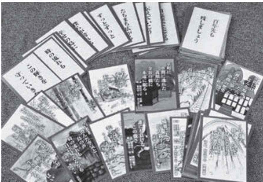
串間の自然や歴史、文化を詠んだ「くしま学かるた」。

◎旧吉松家住宅(和室・大広間) 使用料 ・和室 1時間 200円 ・大広間 1時間 400円 ・使用時間 午前9時～午後9時 ※年末年始の12月29日～1月3日は休館します。