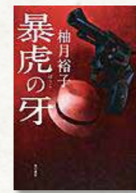
「暴虎の牙」 袖月裕子/著

〈あの絵〉のまえで (原田マハ/著) MISSIN (村上龍/著) あなたが私を竹槍で突き殺す前に (李龍徳/著) クスノキの番人 (東野圭吾/著) 三兄弟の僕らは (小路幸也/著) 私たちの望むものは (小手鞠るい/著) 笑って生きろ (瀬戸内寂聴/著) 図書室のバシラドール (竹内真/著) 静かなる太陽 (霧島兵庫/著) 帝国 (花村萬月/著) 東京ホロアウト (福田和代/著) 緋色の残響 (長岡弘樹/著) 北条氏康 (富樫倫太郎/著)