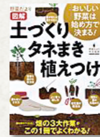
「園芸」特集 今月のテーマ展示

ジャガイモに花はない？ポテトサラダ用のジャガイモがある？知っているようで知らないジャガイモの秘密を、200点以上の写真で紹介し、ポテトチップスができるまでも掲載。ジャケットそでにクイズあり。