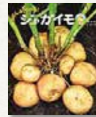
「ぜんぶわかる！ ジャガイモ」 安田守/著、森元幸/監修

平成16年、懲役刑を受けて出所した沖が暴走を始めた矢先、かつて大上の薫陶を受けた呉原東署の刑事、日岡が沖に接近し…。『孤狼の血』シリーズ完結編。学芸通信社の配信により『岩手日報』などに掲載されたものを単行本化。