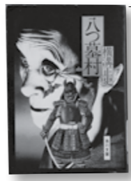
10月のテーマ展 「横溝正史 & ダシール・ハメット 特集」

原発に支えられている、未来を描けない地方都市で生まれ育った男。窒息しそうな日々を揺れ惑った挙げ句に、男が見極めた人生とは？『オール讀物』掲載をまとめて単行本化。