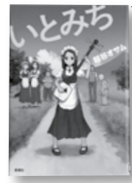
いとみち 越谷 オサム／著