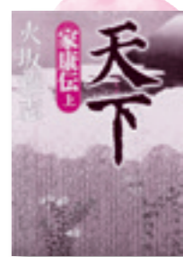
「天下家康伝」(上・下) 火坂雅志/著

信玄・謙信のような軍略の才も、信長の突破力も、秀吉の人間的魅力も持ち合わせていない戦国武将が、なぜ天下人になれたのか。戦国乱世を終らせた武将・家康の実像を描く。