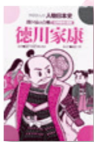
今月のテーマ展示 「伝記・歴史」

お寿司屋さんの定番の一つであるマグロ。生物としてのマグロ、食文化の中のマグロという2つの面で、マグロの全貌を紹介。マグロを取り巻く問題にも触れる。