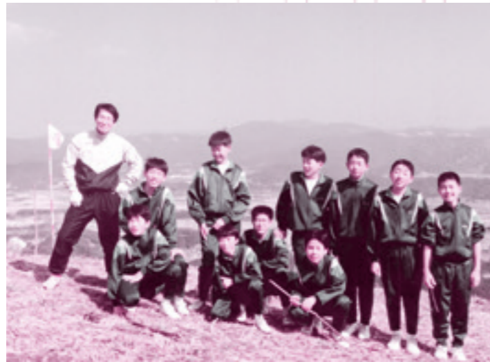
福島中学校時代に卓球部の生徒と第2高畑山で