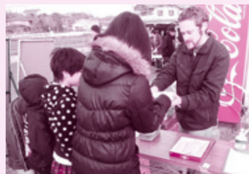
2月のよかむん市の振る舞い

毎月の第3日曜日に朝市の「よかむん市」があります。基本的に場所は商工会議所の広場で、串間でお店をやっている方などが早朝からいろいろなものを売っています。果物や魚、和菓子、麺、コーヒーなどいろいろあります。こういうのはアメリカでは私は見たことがないですが、朝が弱いからでしょうか? (笑) でも串間に来てから行くようにしていますので早起きの訓練にもなっています。よかむん市ではよく振る舞い