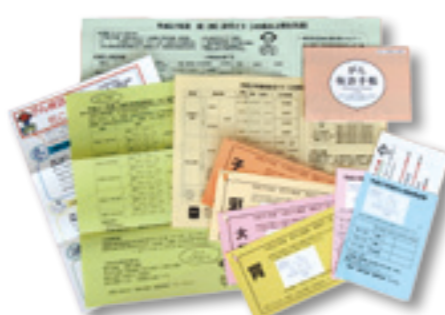
がん検診対象者にお届けしている送付物