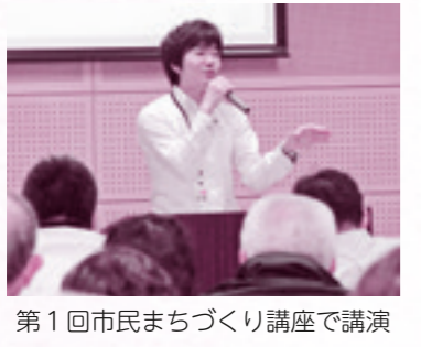
第1回市民まちづくり講座で講演

の取組みとは違つと思ひます。 みなさんも一度は聞いたこ とがあるかと思いますが、こ のまま東京など都市圏への若 者流出と若年女性の減少が進 めば、2040年には全国8 96の市区町村に消滅可能性 があるという、民間研究機関 「日本創成会議」が昨年5月 に公表した試算は、全国の地 方自治体に大きな衝撃を与え ました。この「消滅可能性都 市」に残念ながら本市も含ま れています。 この困難な課題にみなさん と力を合わせて取り組んでい きたいと思つています。串間 の未来について一緒に考えて いけることを楽しみにしてい ます。