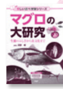
「マグロの大研究 生態のふしぎから食文化まで」 河野博/監修

信玄・謙信のような軍略の才も、信長の突破力も、秀吉の人間的魅力も持ち合わせていない戦国武将が、なぜ天下人になれたのか。戦国乱世を終らせた武将・家康の実像を描く。