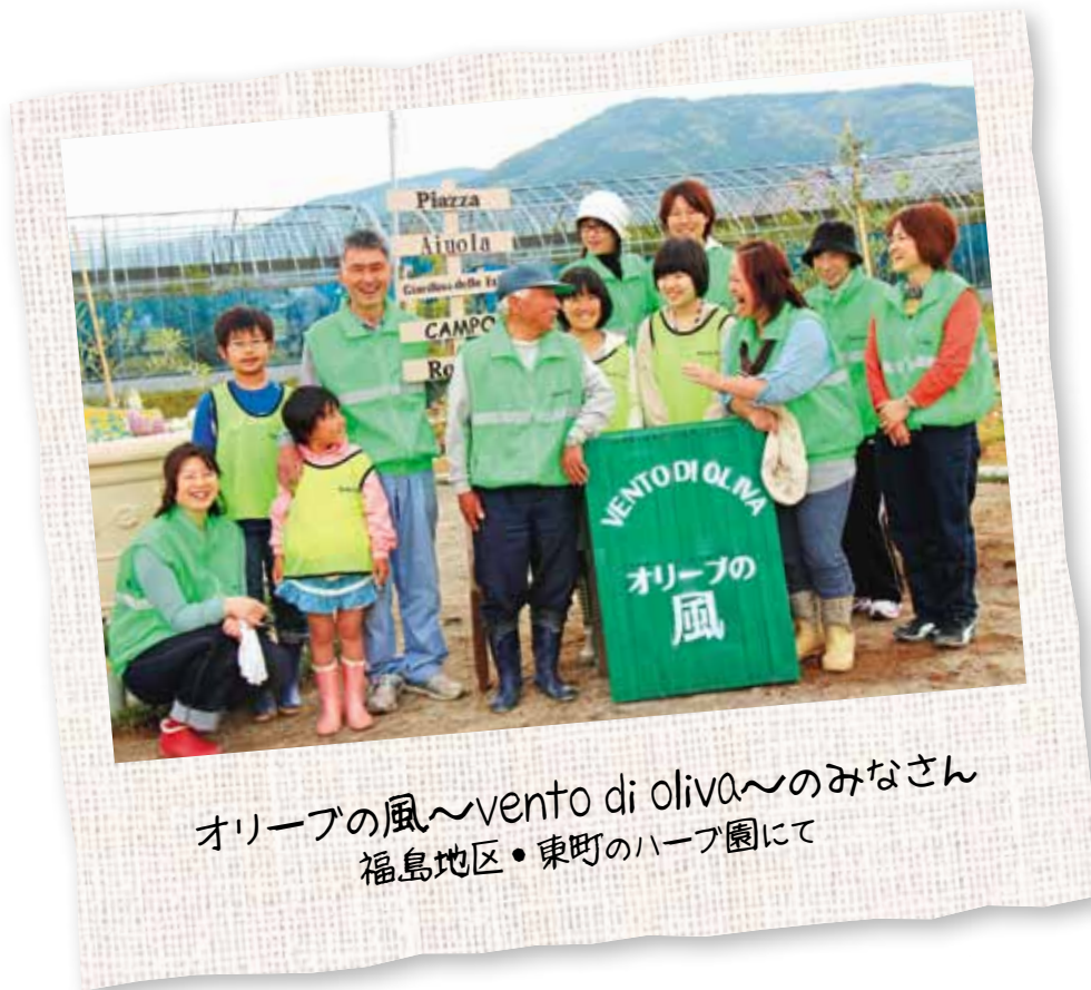
オリーブの風～vento di oliva～のみなさん 福島地区・東町のハーブ園にて