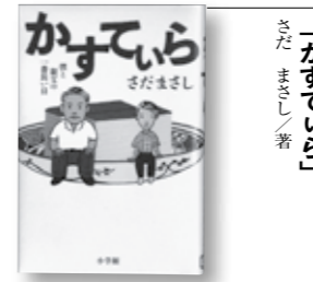
「かすていら」 さだまさし／著

大地震後の江戸を救うべく新米同心が走る! 安政2年10月2日、直下型大地震が江戸を襲った。新米同心虎之助は町人たちの難題を、江戸中を駆け廻りながら解決する。人情、恋愛、謎解きが詰った極上の長編時代小説。