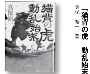
「猫背の虎 動乱始末」 眞保裕一／著

●串間市立図書館 ☎72-1177 ●開館=午前10時~午後6時 ●休館日=毎週月曜日 http://www.kushima-lib.jp/