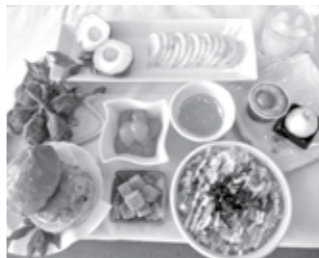
金環日食にちなんだ限定商品

また串間市地場産業振興対策協議会では、今回の金環日食にちなんだ商品を新たに開発しました。金柑を使った加工品や、金環日食