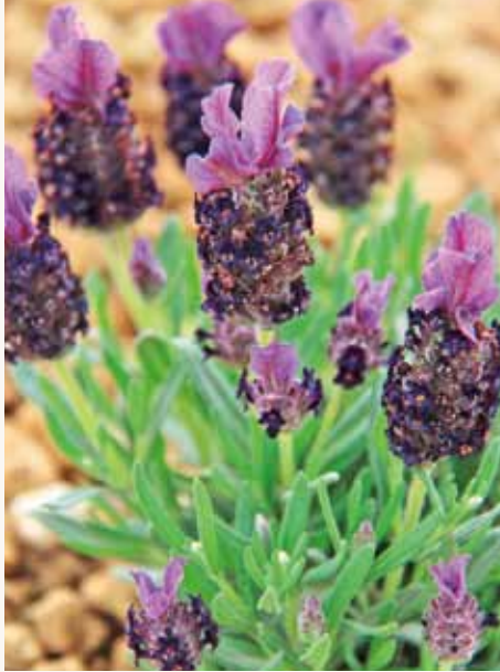
ラビットミニラベンター(オリーブの風ハーブ園にて)