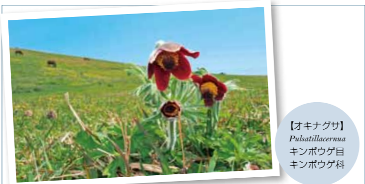
【オキナグサ】 Pulsatilla nuttalliana キンポウゲ目 キンポウゲ科

お誕生のお祝いや、感謝の気持ちをメッセージにして贈りませんか。また、あなたが撮影した写真（人・風景・ペットなんでも可）もぜひ、お送りください。6月17日は父の日です。お父さんへの日ごろの感謝の気持ちを伝えてみませんか。父の日のプレゼントに広報誌、いかがですか。