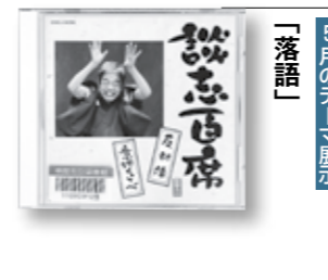
5月のテーマ展示 「落語」

さだまさしが父に捧げるもうひとつの『精霊流し』。若き父の記憶は、カステラの香りとともに故郷の風景を連れてくる... 温かな涙あふれる独自の世界を紡いできた著者の真骨頂とも言える、初の自伝的実名小説。