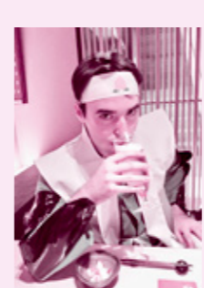
ビールを飲む桃太郎。シュール!

そして、10月の最後の日は何のアメリカンホリデーでしょうか? ハロウィーンです! 僕が一番好きなアメリカンホリデーです。大学生の頃から、10月1日からハロウィーンまで毎晩ホラー映画を観ることにしています。毎晩ルームメイトと一緒に寮の図書館へホラー映画を借りに行き、10月31日のハロウィーンの夜まで毎日映画を見ていました。大学を卒業した今でも、ハロウィーン前のこの習慣を続けています。