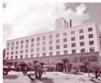
都井岬再興に向けて一歩前進