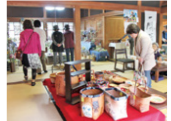
たくさんの方が来場しました

11月1日から3日までの3日間、旧吉松家住宅で吉松邸まつりが開催されました。今年で9回目の開催。古布を使った洋服や小物、さをり織りのマフラー、陶器、木工品、人形、ブローチ、一閑張り作品などが各部屋に並び、たくさんの来場者でにぎわっていました。