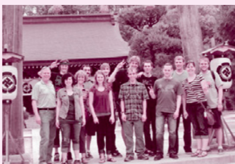
留学時代に遠足 山口県萩市の松陰神社

母国以外の国で生活していると、いろいろ出来事があったりして面白いですね。しかし、ずっとアメリカのインディアナ州にいる私の家族に、串間や日本のことを語ると、面白がってはくれない、理解してもらえないこともあります。でもそれは当たり前かもしれませんね。ずっと同じ場所や環境にいると視野が狭くなりがちだと思います。私も最初に日本に来る前は、ひとつの場所にしか住んだことがなく、来日してからだんだん自分の無知に気づいてきました。初めての留学は下関でした。下関では日本人や違う国からの外国人にもたくさん会えました。授業の勉強の上にもその交流もあってかなりためになりました。なので、やっぱり外国に住んで勉強することは、すごく大事な機会だと思います。そうやって自分の経験の外に踏み出してみ