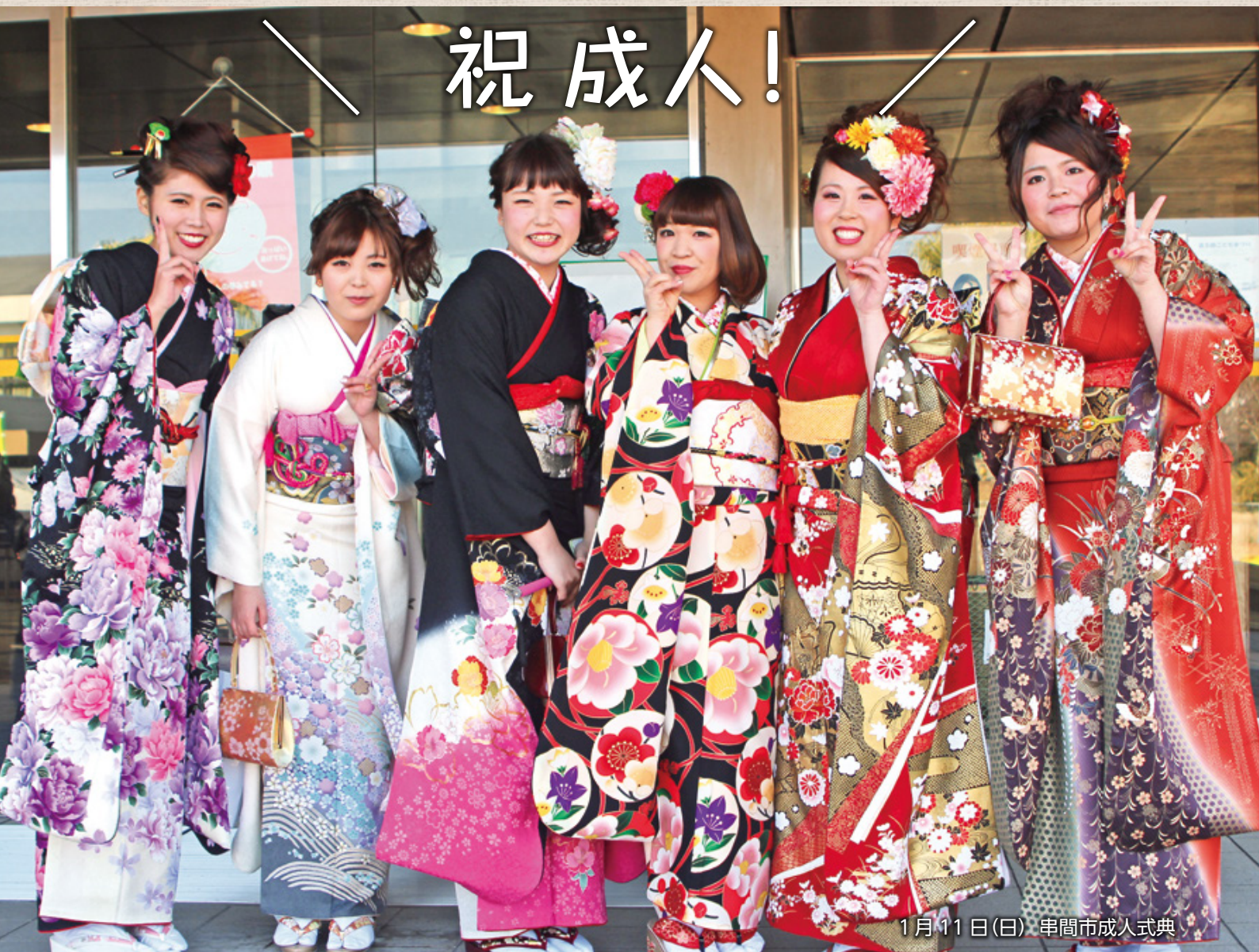
1月11日(日) 串間市成人式典