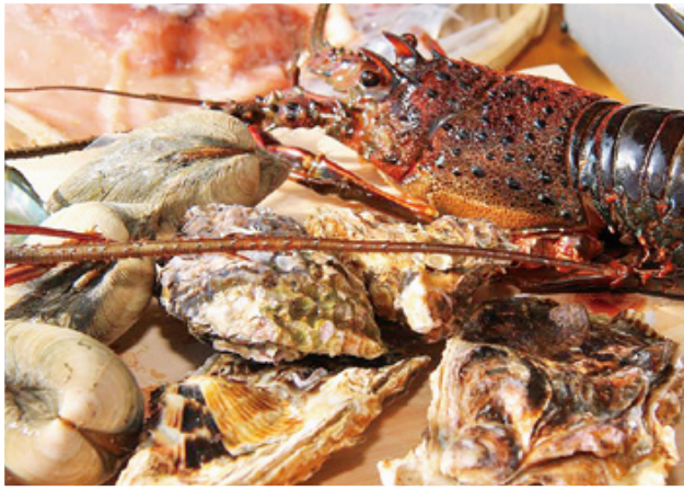
新鮮な魚介類がその場で食べられる 串間市漁協の港の駅「小屋」