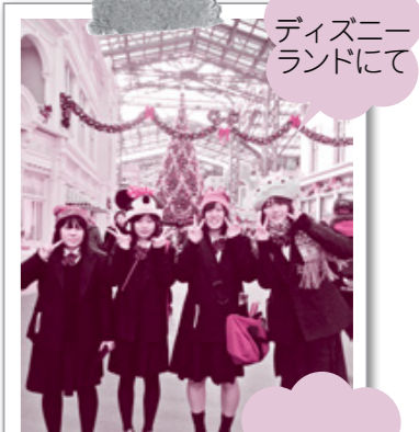
ディズニーランドにて