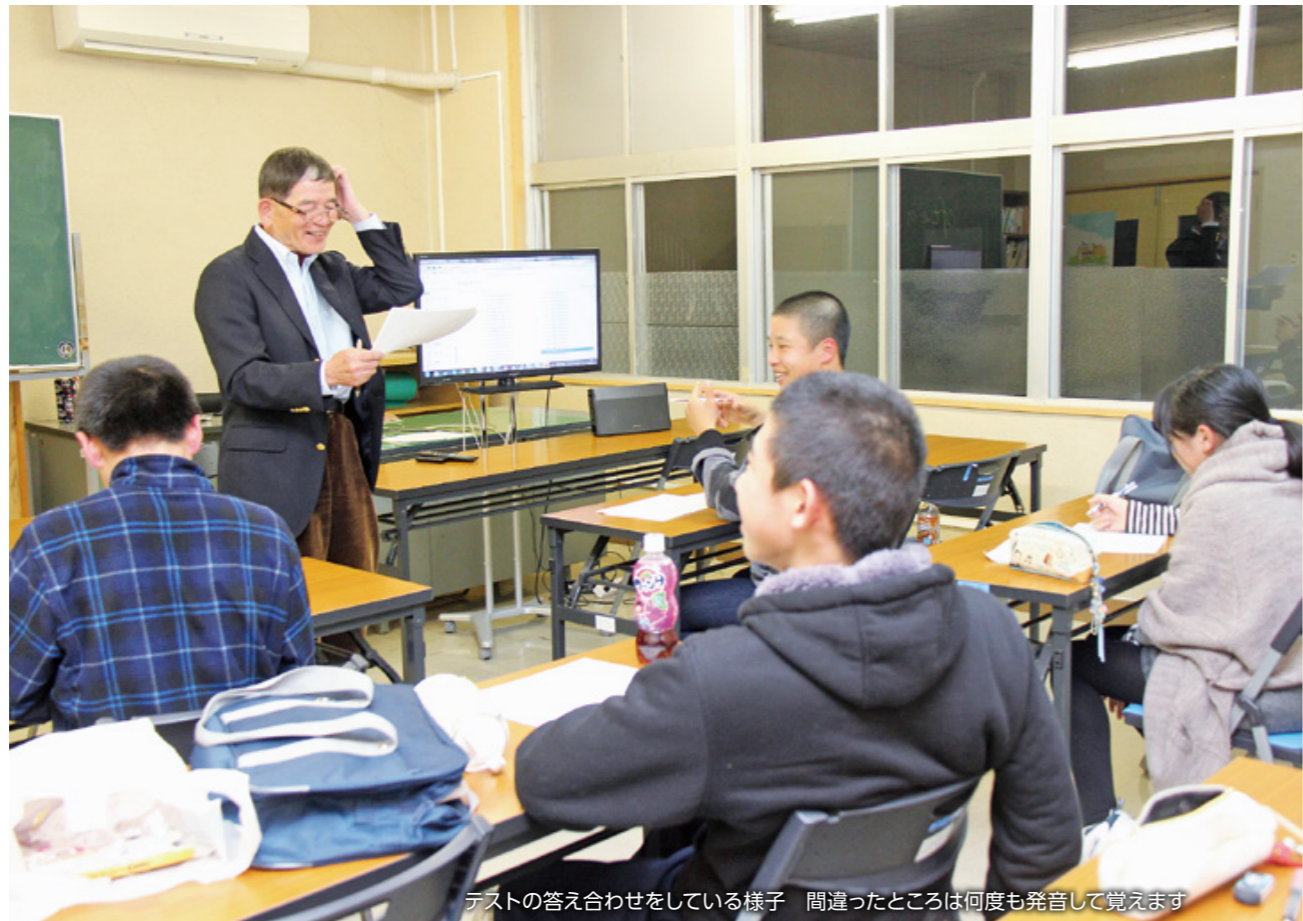
テストの答え合わせをしている様子 間違ったところは何度も発音して覚えます