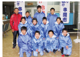
選手の皆さんお疲れ様でした

1月12日（月・祝）『第5回宮崎県市町村対抗駅伝競走大会』が宮崎市で行われました。串間市チームの結果は2時間19分32秒。市郡の部18チーム中17位と、昨年と同じ順位でしたが、チーム一丸となった懸命な走り、見事1本のタスキを最後まで繋ぎ切りました。