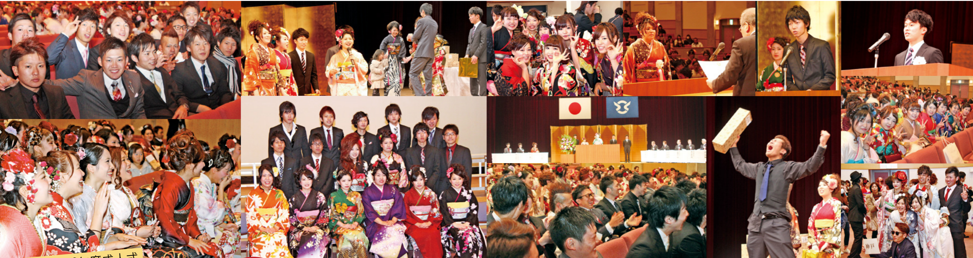
祝 平成26年度成人式