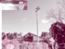
自治会放送設備(大東地区)