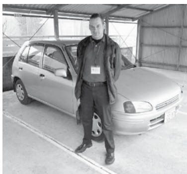
わたしが持っているスターレット

さて、前回日本に来たときは運転しなくてもよかったのですが、今回は生活やさまざまな仕事の活動のために、ほぼ毎日運転しなくてはなりません。広い母国のアメリカでも運転してました。日本は道路が狭くクルールが違うところが多々あります。たとえば、日本では踏切で必ず一旦停止しないといけません。アメリカでは遮断機が下る