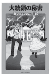
「大統領の秘密」 メアリー・ホープ・オズボーン / 著