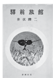
2月のテーマ展示 「井伏鱒二特集」