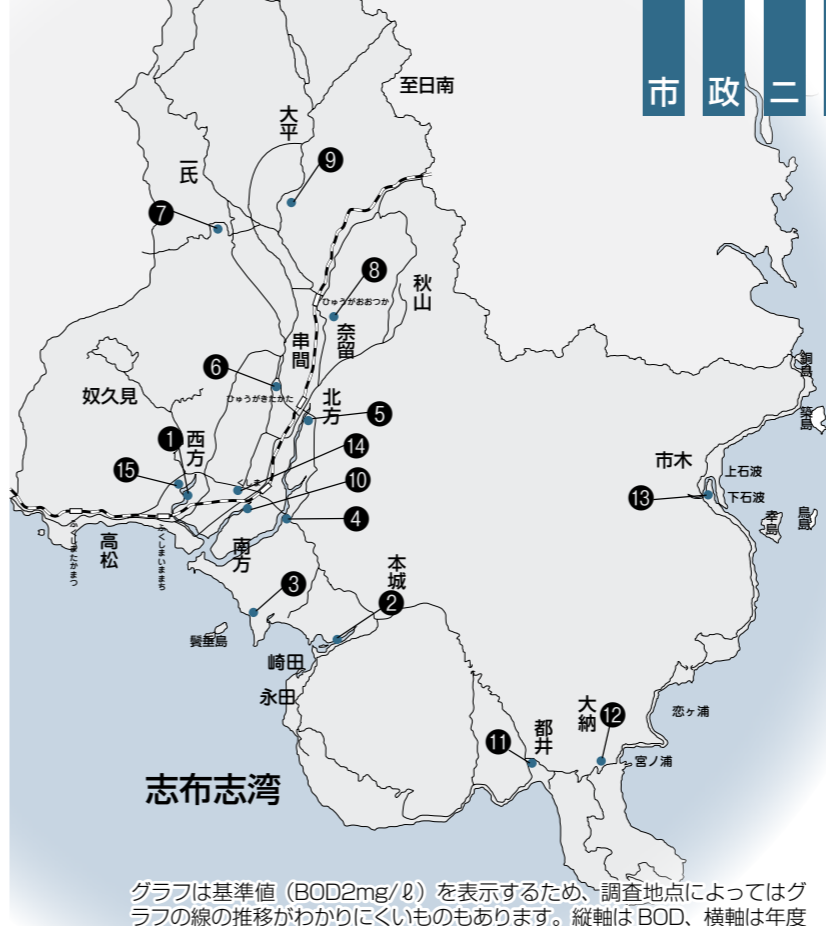
グラフは基準値（BOD2mg/ℓ）を表示するため、調査地点によってはグラフの線の推移がわかりにくいものもあります。縦軸はBOD、横軸は年度です。※但し、③下弓田の縦軸はCODになります。