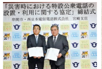
「災害時における特設公衆電話の設置・利用に関する協定」締結式 串間市・西日本電信電話株式会社 宮崎支店

1月26日、本市と西日本電信電話（NTT西日本）宮崎支店が、災害発生時における被災者などの通信手段の確保を図ることを目的に、特設公衆電話の設置・利用に関する協定を締結しました。設置場所は、中央公民館、本城小学校などの避難所8カ所を予定しています。