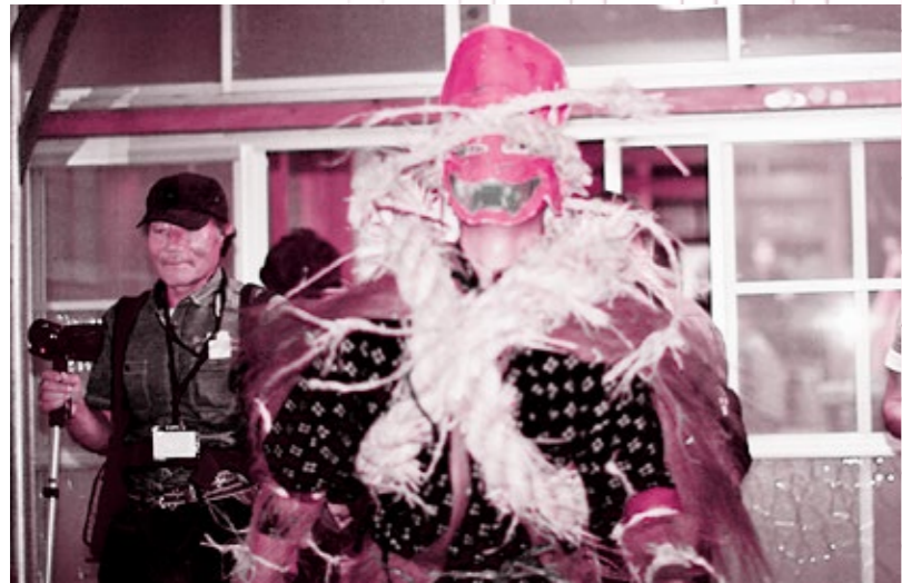
大東広野地区の「もぐらもち」のビデオ撮影