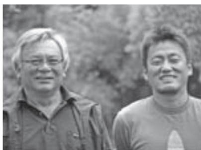
「サルのおもしろいですよ」と観察員の皆さん