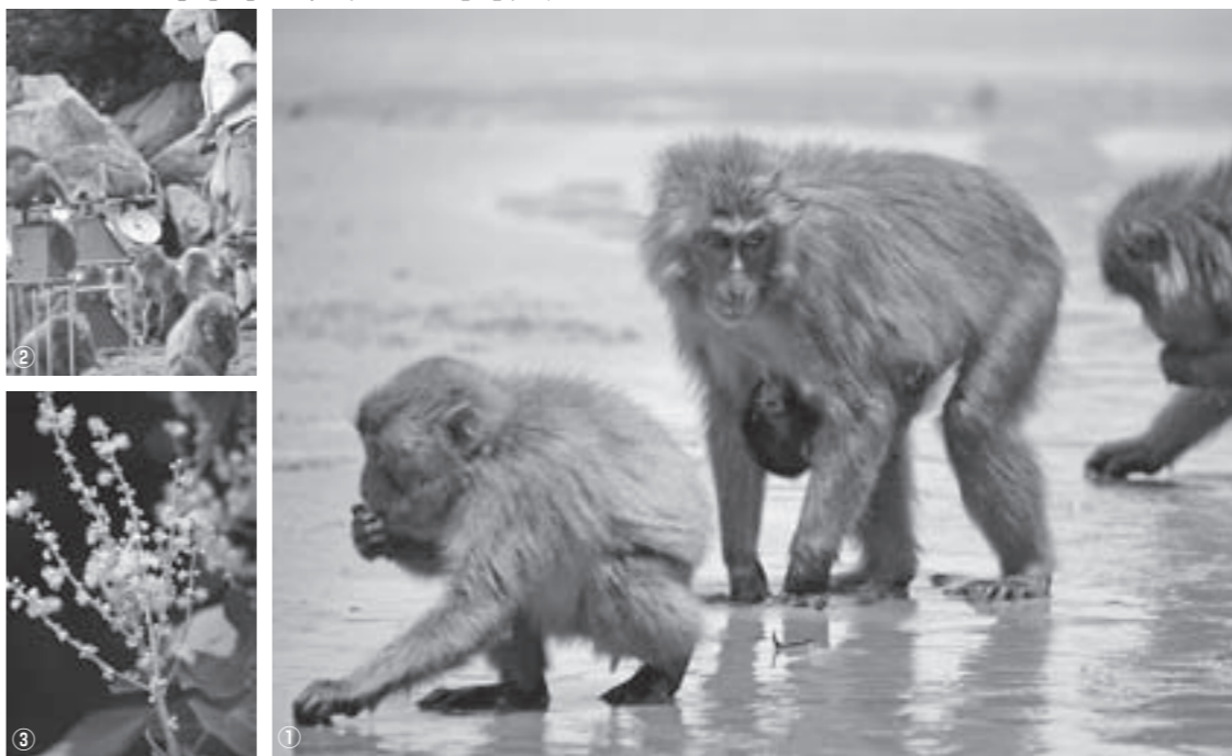
①今年誕生第1号の子ザル ②月に1度の体重測定の様子 ③幸島は亜熱帯性植物が多く、季節ごとの花も見どころ

祭神『市杵島姫命』が祭られていました。源平合戦で平家が敗れると、その神体を市木の川からイカダで流しました。流れ着いたところが無人島の幸島。村民が