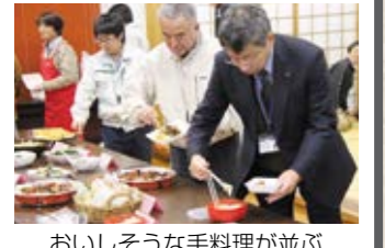
おいそな手料理が並び

1月13日、市農村改善センターで『第10回串間んよかむんを食べてみる会』が開催され、農家女性で構成される串間21レディの皆さんが地元食材を使った手料理を振る舞いました。同グループは、今年度をもって解散する予定で、この日は家族などこれまでお世話になった方々を招待しました。