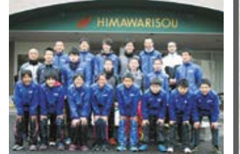
選手の皆さんお疲れさまでした

1月10日、『第6回宮崎県市町村対抗駅伝競走大会』が宮崎市で行われました。串間市チームの結果は2時間19分08秒で、市郡の部19チーム中17位でしたが、チーム一丸となった懸命な走りです。昨年より総合タイムを24秒短縮し、最後までタスキをつなぎ切りました。