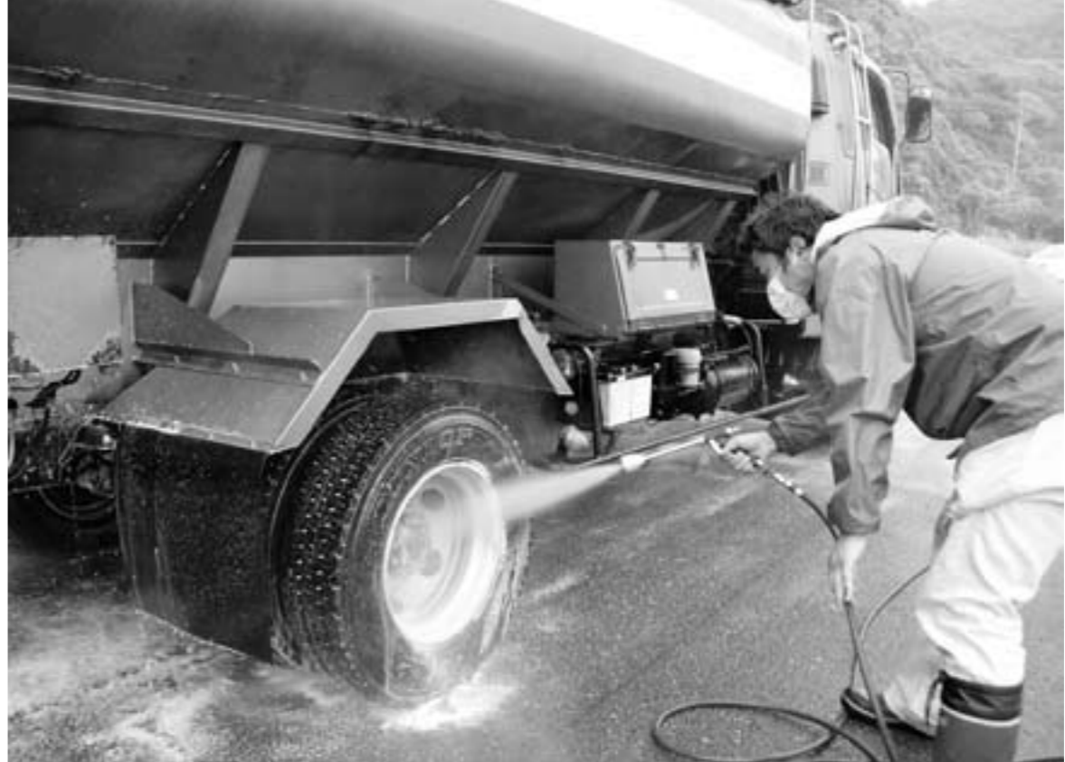
国道220号高松トンネル先での車両消毒

県内で感染が拡大した家畜伝染病「口蹄疫」。その猛威は、いまだ予断を許しません。感染拡大を防ぐために、市民一丸となった取り組みをお願いします。