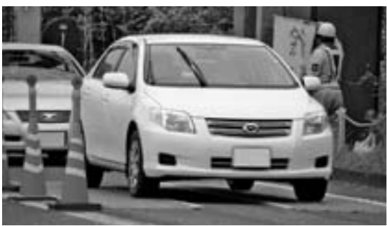
マットによる消毒地点では徐行運転をお願いします。

※水分を吸収するマット、バスタオル、じゅうたんおよび、使い古しの毛布などに消毒液を浸してください。浸した消毒液が乾燥したら再度浸し