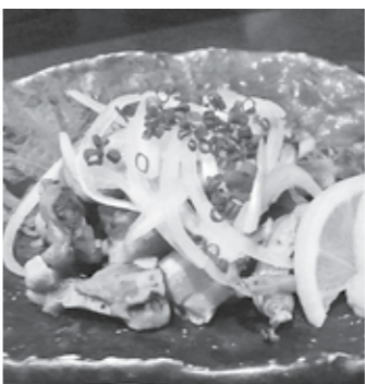
大好きな鶏のたたき

でもたたきには出来る訳ではない のです。日本の技術と商品に かける手間暇のおかげで、こん なおいしい物が食べられると 知り感動しました。海外では 「生」で肉や魚を食べることは ほとんどありません。最近では お寿司ブームなどで少しずつ生 の魚を食べられるお店が増えて きましたが、やはり「生」と聞 くとためらう人が多いです。 ニュージーランドの友達にも鶏 のたたきを食べてもらいたいの ですが、難しいかもしれません : 日本に来てもらうしかないで すね!