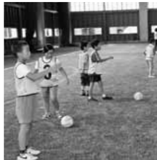
昨年のいきいきスポーツランド

詳細については、後日チラシなどにてお知らせいたします。皆さまの参加をお待ちしております。