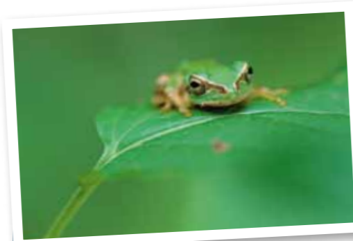
串間の小さな生き物 ～ニホンアマガエル～ 【ニホンアマガエル】 Hyla japonica 無尾目 アマガエル科

お誕生のお祝いや、感謝の気持ちをメッセージにして贈りませんか。また、あなたが撮影した写真（人・風景・ペットなんでも可）もぜひ、お送りください。