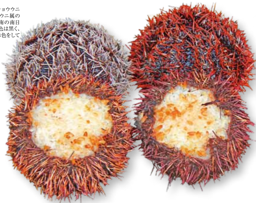
【シラヒゲウニ】 棘皮動物門ウニ綱サンショウウニ目ラッコウニ科シラヒゲウニ属の棘皮動物。紀伊半島以南の南日本に生息している。殻の色は黒く、棘は白色のほか橙色や赤色をしているものもある。