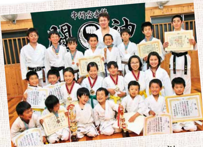
串間空手塾「緑勝会」のみなさん ～福島地区・仲町の道場にて～