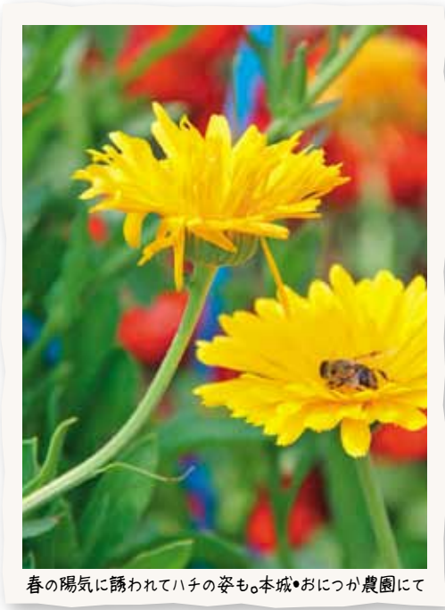
春の陽気に誘われてハチの姿も。本城・おにつか農園にて