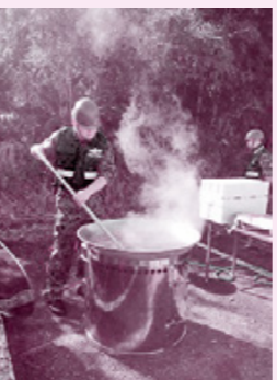
イベントでカレーを作る自衛官

最近の交流ですが、高畑山にある航空自衛隊の分屯基地で英語教育を行いました。他の外国人数人から、市木に行く途中で道を間違えて山を登ると、厳しい目をしている軍人に遭遇して焦って引き返したという話を聞