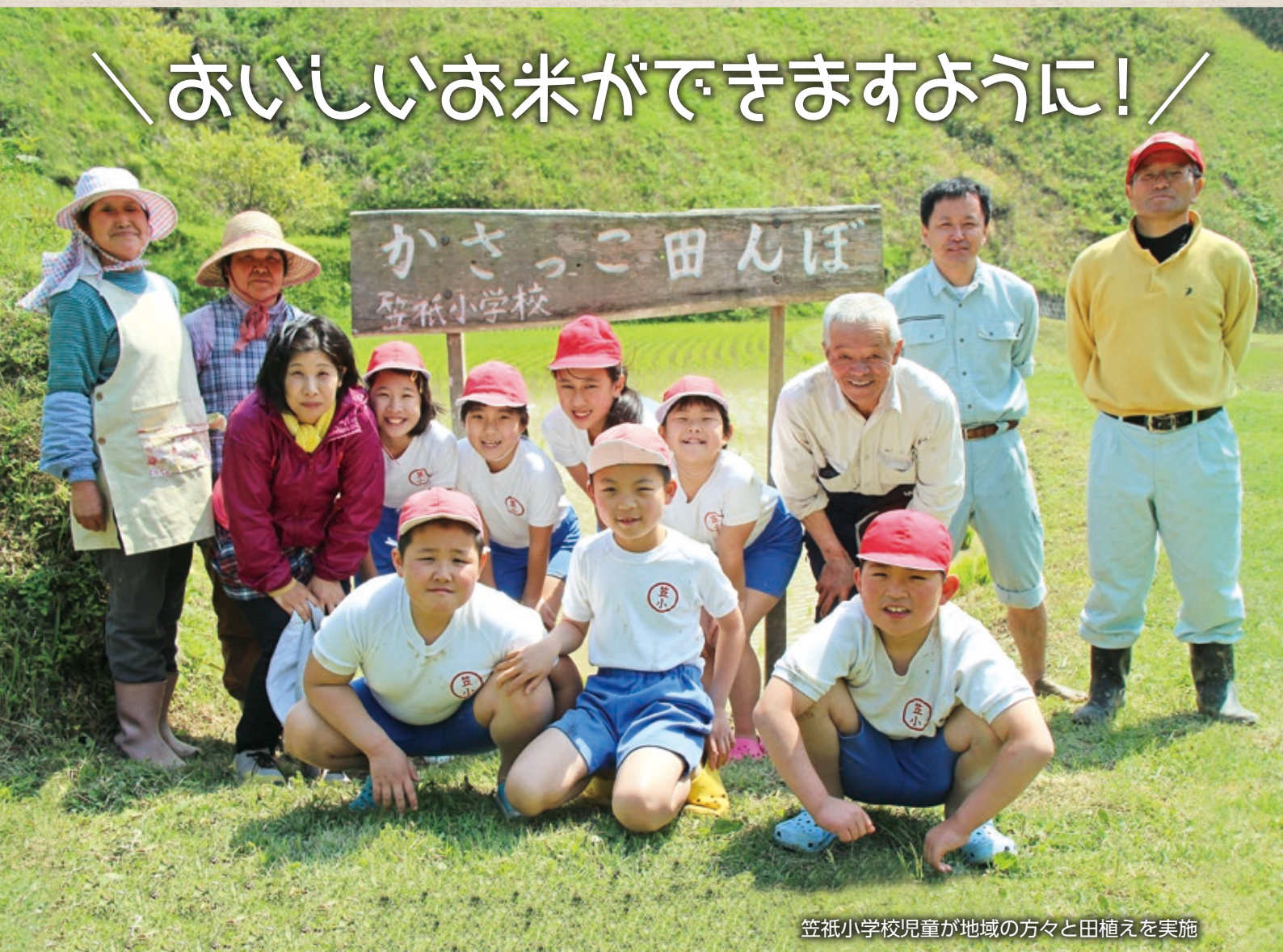
笠祇小学校児童が地域の方々と田植えを実施