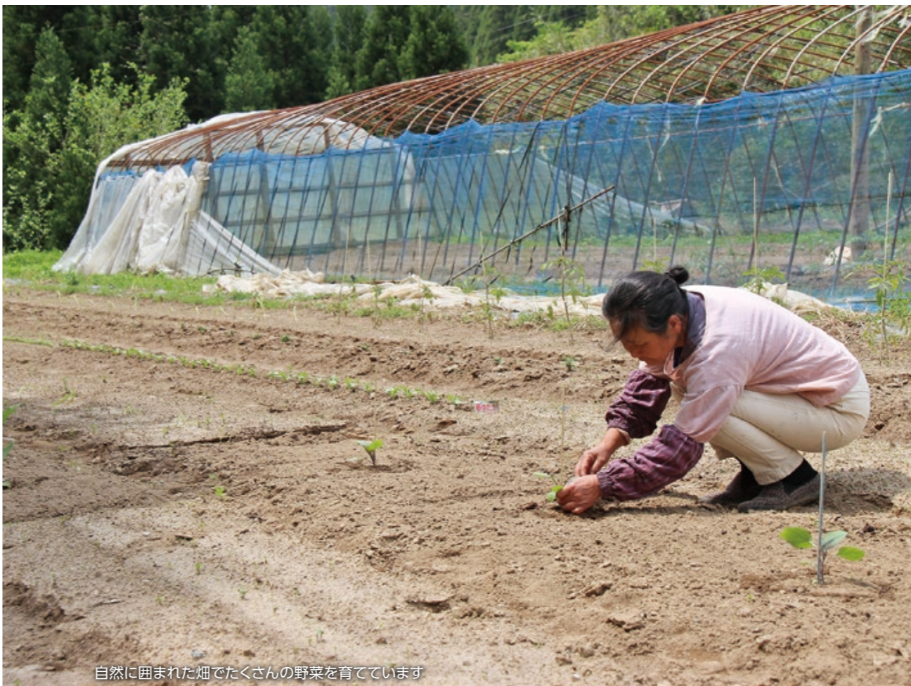
自然に囲まれた畑でたくさんの野菜を育てています