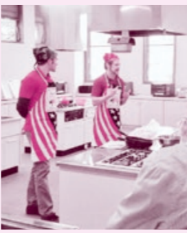
料理教室の最初の自己紹介

理するとかやり方が少し違ったり、「こつ」と調理の仕方もあるんだ!とお互いに驚くことが必ずあります。たとえばスクーンの生地を折り畳むことで層を作ることなどです。 レシピは私が自分で和訳してみたもので「これどういう意味?」と生徒さんたちに何回も聞かれたり、参加者はアメリカ南部風のスクーンを作るのが初めてだったので、本来20分しかかからないレシピが1時間くらいかかったのですが、外国料理を教えるのはそういうものですね。みんなで交流しながら作ることができて良かったと思います。参加者の皆さんも何回も「へえ!」とか「おいしい!」と言っていたので楽しかったみたいです。教室は終わりましたが、機会があればまた作りましょう!