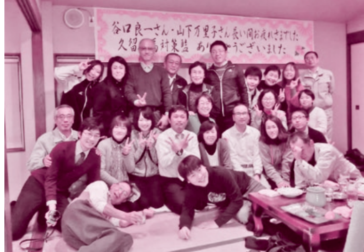
串間市役所市民生活課の皆さんと

串間市民の皆さん、そして、串間市職員の皆さん2年間ありがとうございました。2年前に串間市役所派遣と内示を受けたのが、つい先日のような気がします。不慣れた仕事でしたが、職場の皆さまをはじめ、たくさんの方々のおかげで、たくさんの方々に助けていただき、何とか大過なく過ごすことができました。