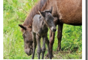
母馬に寄り添う第一号の春駒

都井岬に生息する国天然記念物の岬馬の赤ちゃん「春駒」が、出産シーズンを迎えています。記念すべき第1号は3月31日（火）午後1時すぎに発見された青毛の元気な雄。母馬に寄り添いながら歩く可愛らしい姿や、のびのび元気に駆け回る姿を見せていました。