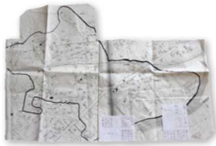
地区内を把握するために手作りした地図

1年間歩き回ることを感じたのは、高齢者が多いということ。このあたりの地区は、昔から住んでいる世帯が少ないので市木や都井地区などと比べるとつながりが薄いように感じます。せめて両隣に住むご近所さんくらいは把握して、近所に高齢者が住んでいるのであれば声掛けなどしてつながりを大切にしたいですね。グラウンドゴルフ大