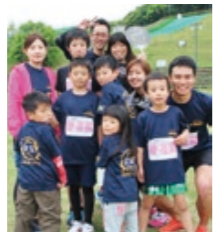
鹿児島県霧島市 SINTORYのみなさん 声援が後押し

4月12日、市総合運動公園で『第2回串間さくらリレーマラソン』が開催されました。一般、職場、ファミリーの各部門に7チーム46人が参加。大会は、運動公園内の1周1kmの特設コースで実施され、4〜10人のチームがタスキをつなぎ、フルマラソンと同じ距離の42・195kmを走りました。参加者たちは仲間や家族の応援を背に、各チームそれぞれのペースでタスキをつなぎ、絆を強めながらゴールを目指しました。