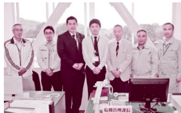
危機管理課の職員

串間地区防犯協会では、地域安全意識の普及と高揚、犯罪や事故を未然に防止する地域安全活動を推進す