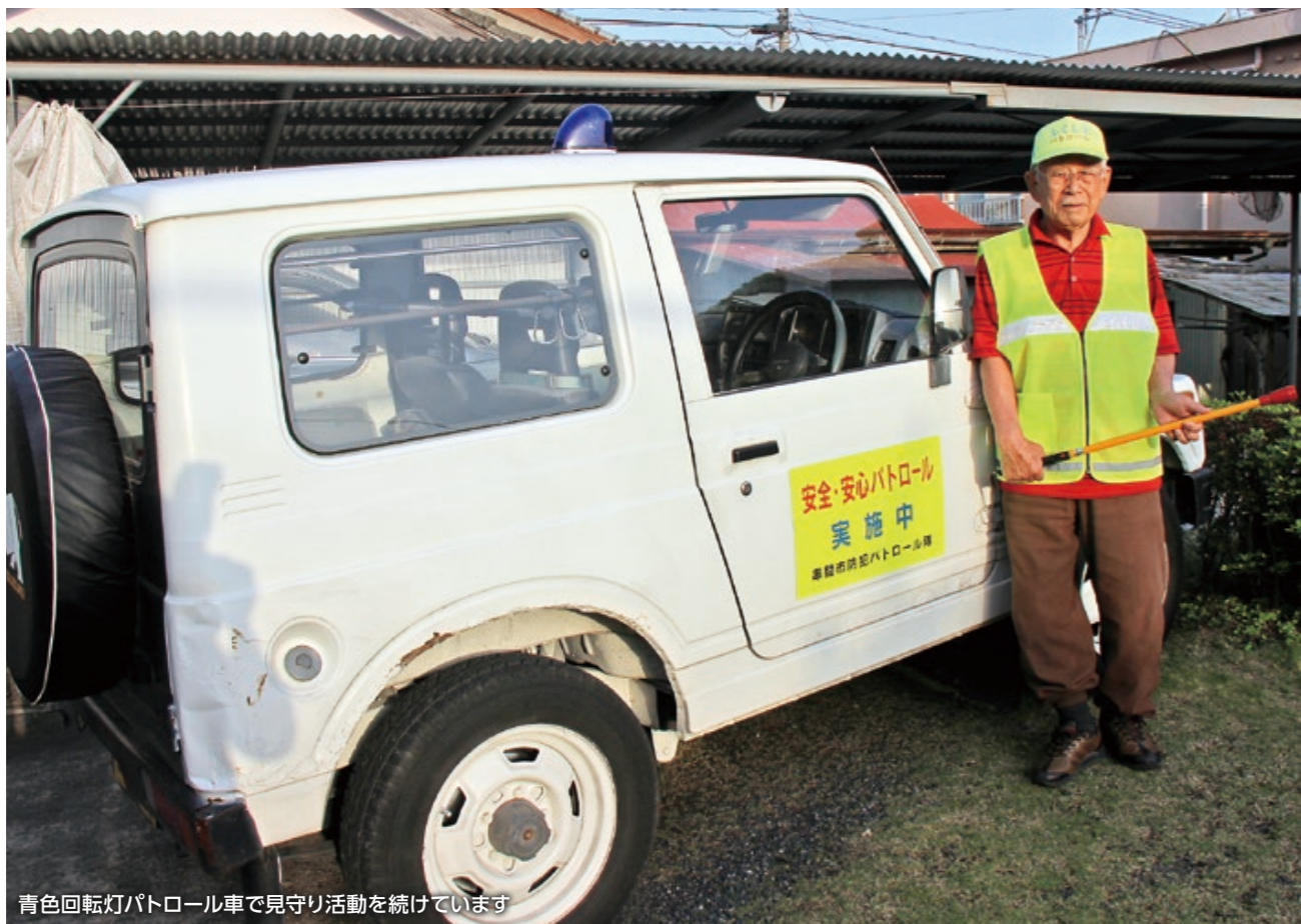
青色回転灯パトロール車で見守り活動を続けています