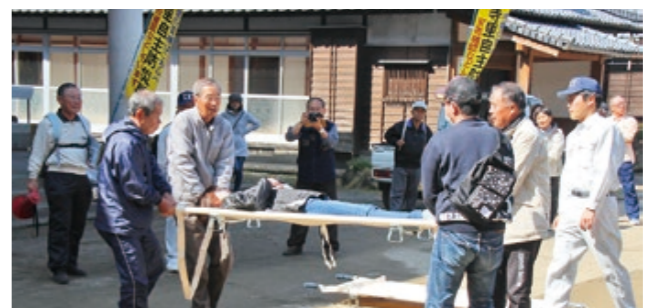
3月に実施された防災訓練

若い人たちも、積極的に自治会活動に参加してほしいですね。現役世代は、仕事をしながらでなかなか参加も難しいかもしれませんが、スポーツなどで交流の場を作ったり、参加しやすい環境づくりを心掛けていきたいと思えます。