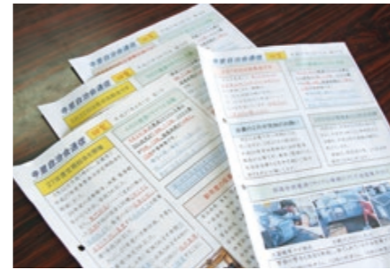
2年間で作成した自治会通信は43号に

えています。今後は、防災隊が有効に機能するかなどの検証を行っていききたいですね。また、いざというときのための災害基金の創設も検討していきたいと考えています。