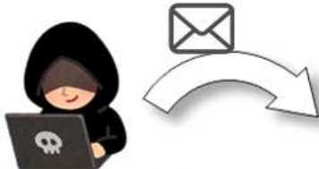
(悪意あるユーザー)

マルウェア(ウイルス)に感染したり、 銀行の口座番号やキャッシュカードの 暗証番号など個人情報が流出する恐れ があります。