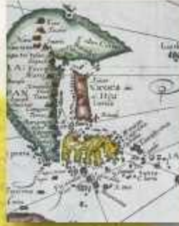
リンスホーデン 東インド地域図 ／神戸市立博物館蔵