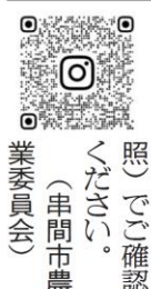
（串間市農業委員会）

プも販売しており、今も地元のおいづか農園で収穫している。今も地元のおいづか農園で収穫している。今も地元のおいづか農園で収穫している。