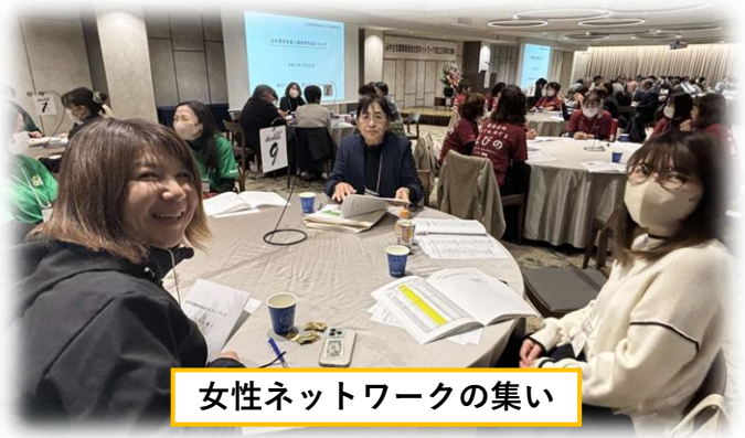
女性ネットワークの集い