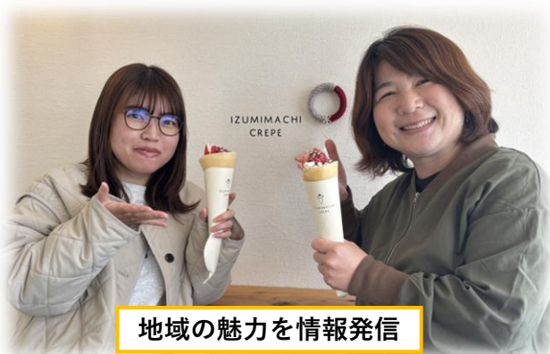
地域の魅力を情報発信

最初は不安でしたが、地域農業のキーパーソンに顔を覚えてもらい、活動がしやすくなりました。女性農業者の団体や活動を知ることで、「みんなでやっている」という仲間意識が芽生えてきたことも良かったです。活動を通じて、若い農業者や女性農業者に頼られる・相談されやすい農業委員になりたいですね。そして、その人たちと一緒に委員活動をしてみたいです。