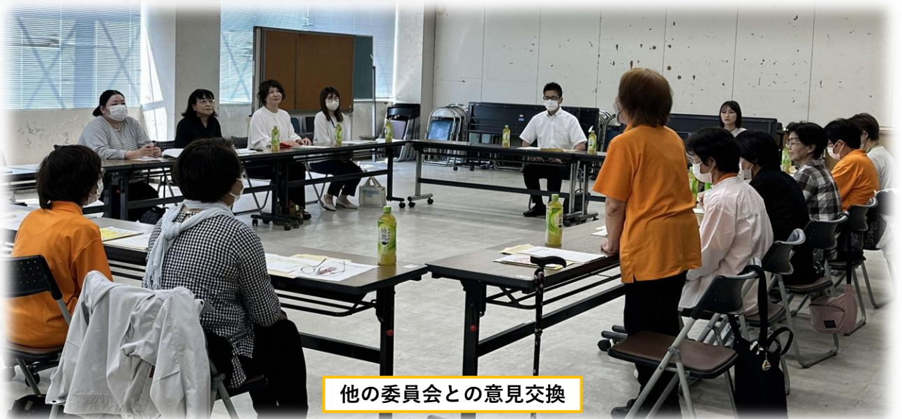
他の委員会との意見交換