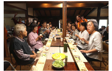
孟宗竹の器においしさも倍増でした

5月13日、グループホームほたるでカラオケ大会が開かれました。本城地区内外から9名の参加者があり、自慢の喉を披露致しました。利用者の方も一緒に歌われたりして、楽しい交流の輪が広がりました。グループホームほたるは、オンラインジカフェにも積極的に参加され、地域との交流を深められています。