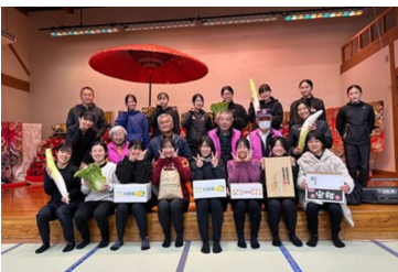
昨年の差し入れ贈呈の時の記念写真

今年も串間温泉いこの里を拠点に、2月20日から名城大女子駅伝部の合宿が行われます。朝夕本城一円を走る彼女らの姿を見ると元気をもらいますが、私たちも彼女たちに「頑張れ！」と声援を送りたいと思いま