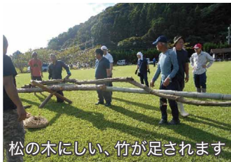
松の木にしい、竹が足されます