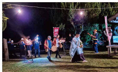
勢子のみんで縄を担いで宮司さん先頭に入場してきます。