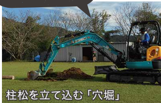
柱松を立て込む「穴堀」