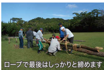
ロープで最後はしっかりと締めます