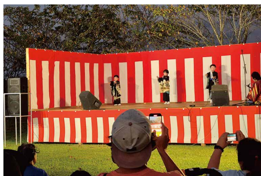
子どもたちの演技、大人たちの歌唱、踊り。 市木はみんな芸達者。