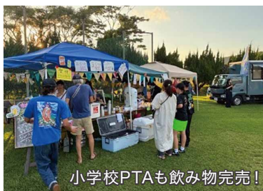
小学校PTAも飲み物完売！