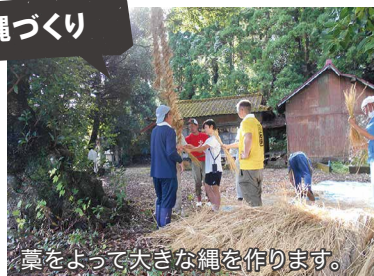
藁をよって大きな縄を作ります。