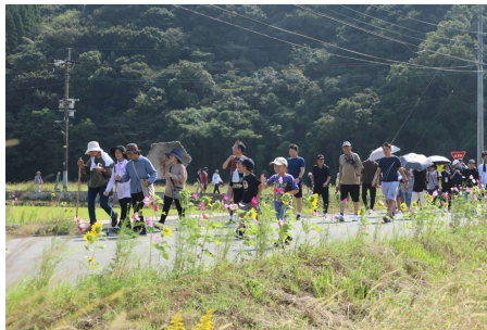
思い思いの出で立ちで歩きました