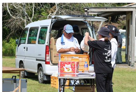
残念、でも嬉しいお楽しみ抽選会でした 好評だったカレー、あっという間に売り切れました