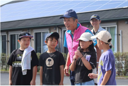
子どもたちの元気なかけ声でスタートです

スタート時の気温は29度。少々汗ばむ暑さでしたが、吹き渡る風は爽やか。絶好の歩こう会日和に恵まれ、令和七年度の「ひまわりコスモス歩こう会」が開催されました。